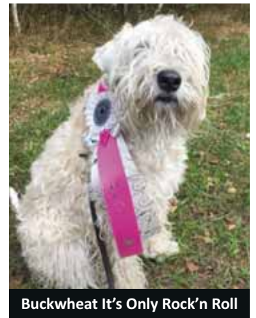
Buckwheat It's Only Rock'n Roll