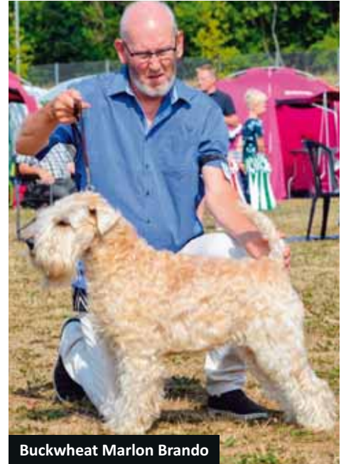
Buckwheat Marlon Brando