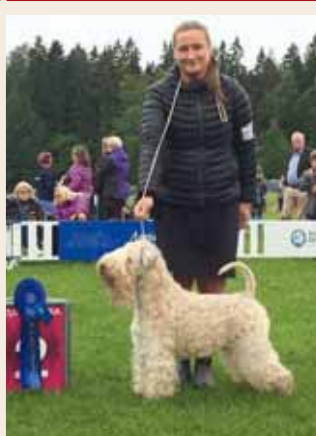
MultiCh MultiW Extra's Esquire Top Winning DTK 2018