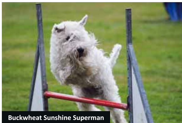
Buckwheat Sunshine Superman