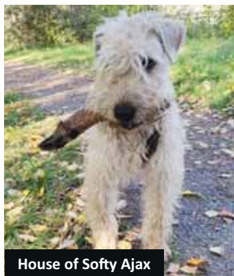
House of Softy Ajax