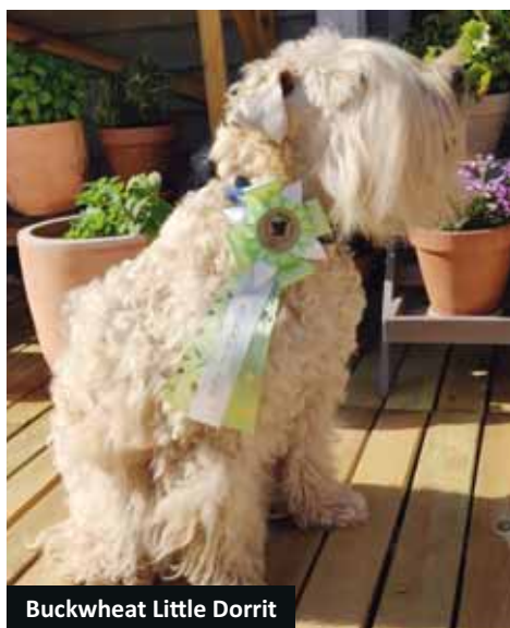
Buckwheat Little Dorrit