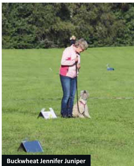
Buckwheat Jennifer Juniper