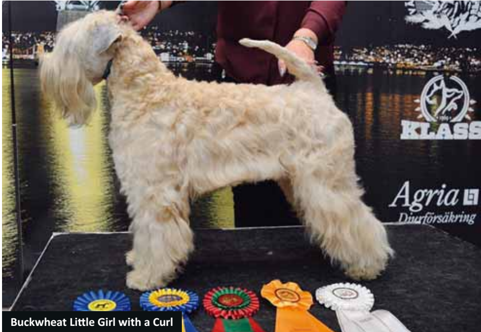
Buckwheat Little Girl with a Curl