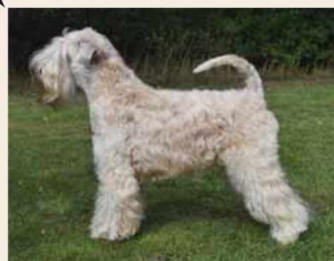
DTK JunCh DKUCH T. Passion For Fashion