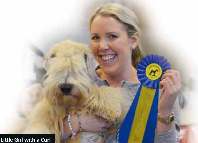
Buckwheat Little Girl with a Curl