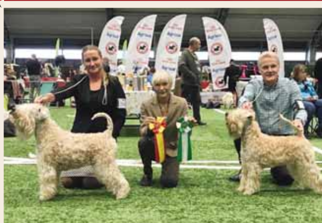
MultiCh MultiW Extra's Esquire & MultiCh MultiW Tejarpsdalens Marion my Precious