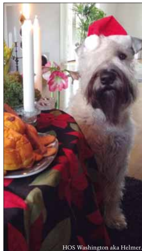
HOS Washington aka Helmer.