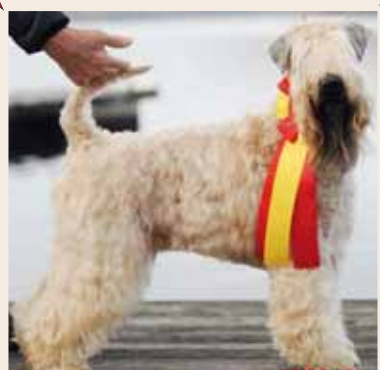
SEUCH DKUCH NOUCH NORDV- 15 NOV-16 SEVCH (C:I:B) T. Ophiuchus. Ägare L&U Persson