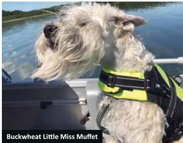
Buckwheat Little Miss Muffet

■ DKUCH House of Softy Ajax GODKÄNT DOFTPROV EUKALYPTUS