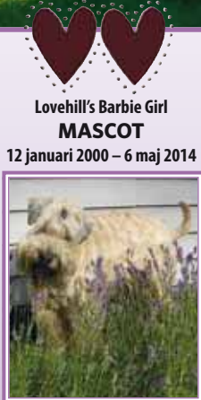
Lovehill's Barbie Girl MASCOT