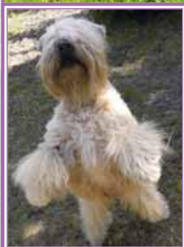
Multi Ch Buckwheat Helga Hufflepuff TRULSA