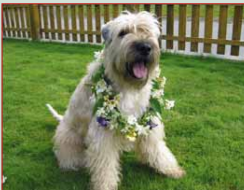
SE UCh DKUCh Lakkas Lord Lambourne

Håll ut! Bara sex månader till Midsommar