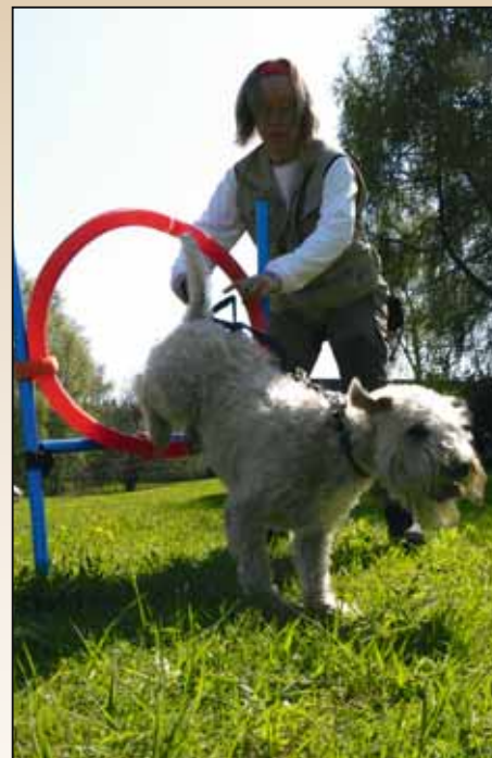
Ludde genom ringen utan problem!

Tja, det kan man säkert men det var inte riktigt huvudsyftet när jag föreslog till SWTK's Regionsstyrelse i Stockholm att få anordna en Seniorkurs för Wheatens 7 +.