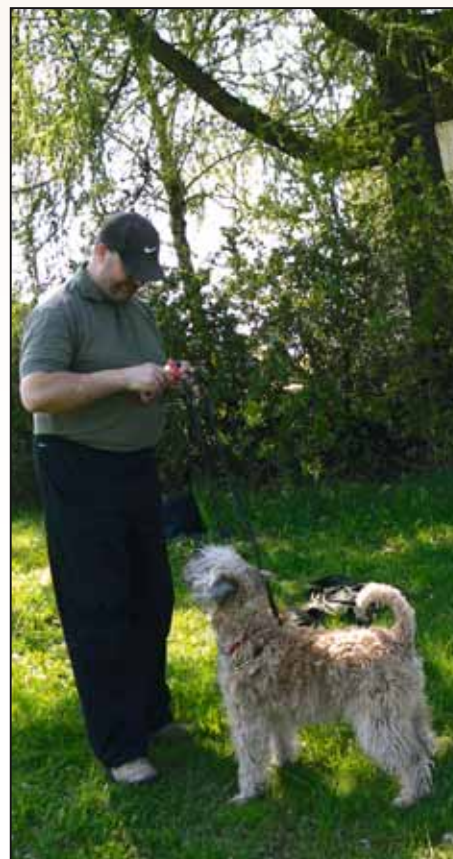
Idefix väntar på belöningen, mjukost i tub!

Första träffen inleddes med en aktiv promenad för att bilda flock. En härlig blandning hundar med lite olika förflutet, några gamla "vänstervarvare", ett