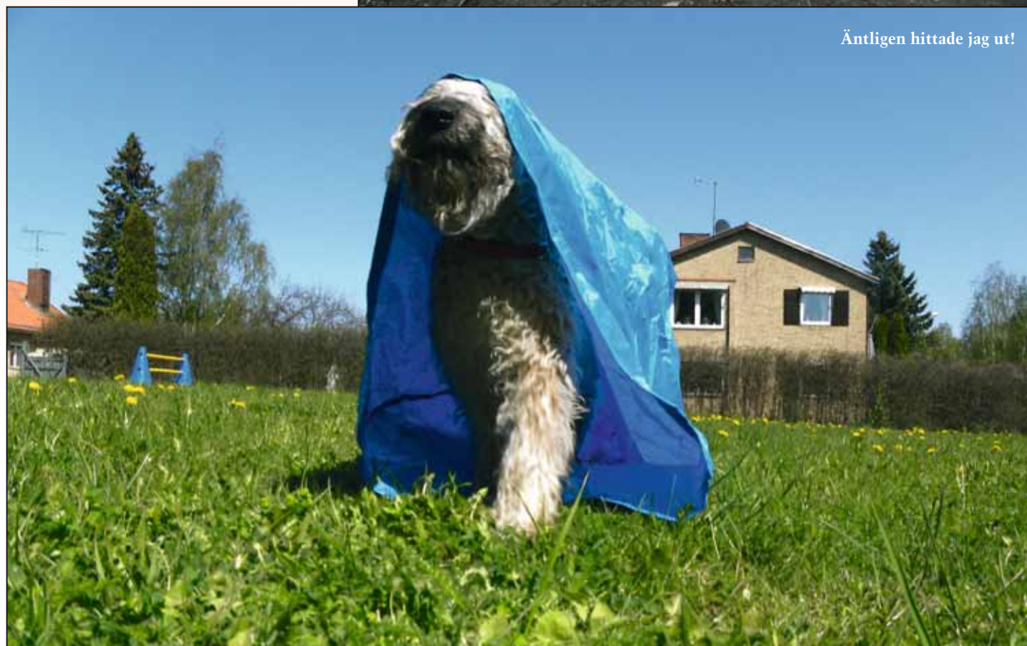
Äntligen hittade jag ut!