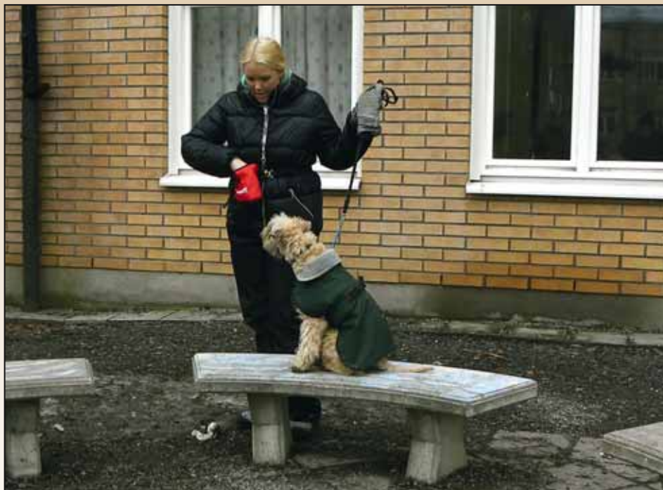
Edit och Mascot jobbar med balansövningar och har fin kontakt.