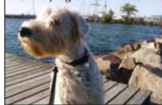
/SOFIE KRANTZ & SKÄGG-STINA